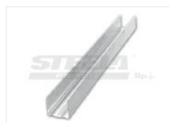
Потолочный профиль UD30