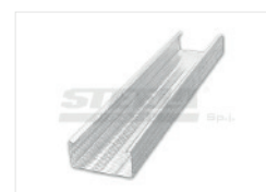
Потолочный профиль CD60