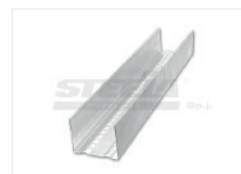
Стеновой профиль U50

* Максимальное расстояние между профилями составляет 800 мм. Расчеты приблизительные для профилей длиной 3 м. Профили "С" и "U" должны применяться в одной и той же ширине.