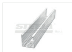
Стеновой профиль C50